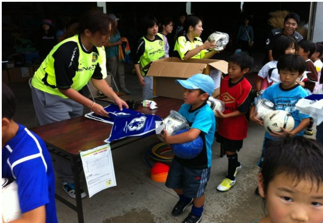
⑭ 参加賞お渡し風景(JFA/オフィシャルパートナーからの提供物を渡している様子)